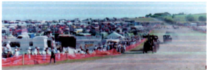
1991 - Bilder von Roland Steiger